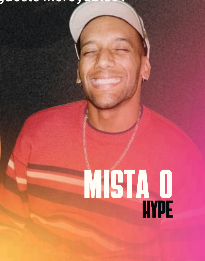
MISTA O HYPE